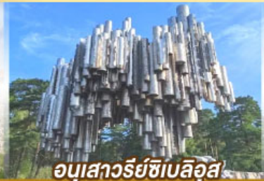
อนุสาวรีย์ซีเบลึอุส