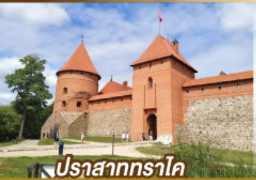
ปราสาททราโค