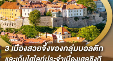
3 เมืองสวยจิ้งของกลุ่มบอลติก และเก็บไฮไลท์ประจำเมืองเฮลซิงกิ และล่องเรือเฟอร์รี่ข้ามประเทศ

ไฮไลท์ในโปรแกรม • เที่ยวสามประเทศหลักกลุ่มบอลติก • ชมเมืองหลวงวิลนิอุส ประเทศลัตเวีย