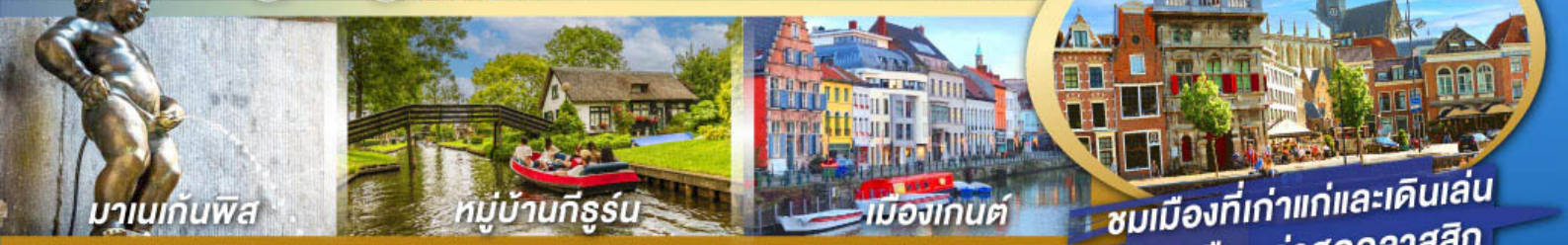
มานเนกันพิส