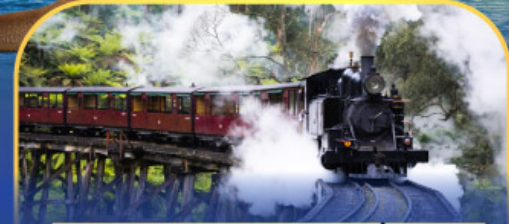
รถไฟพัพพิงบิลลี่

ล่องเรือชมอ่าวซิดนีย์พร้อมรับประทานอาหารกลางวัน และ เข้าชมสวนสัตว์การองก้า