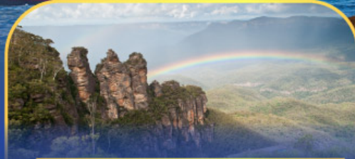
อุทยานแห่งชาติบลูเมาท์เทนส์ Three Sister Rock