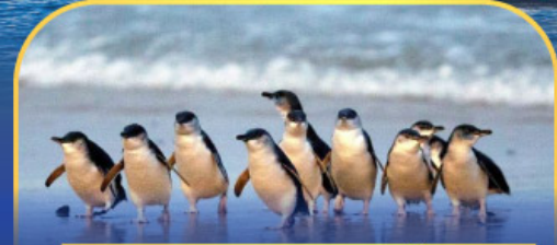
พาหรดนกเพนกวิน