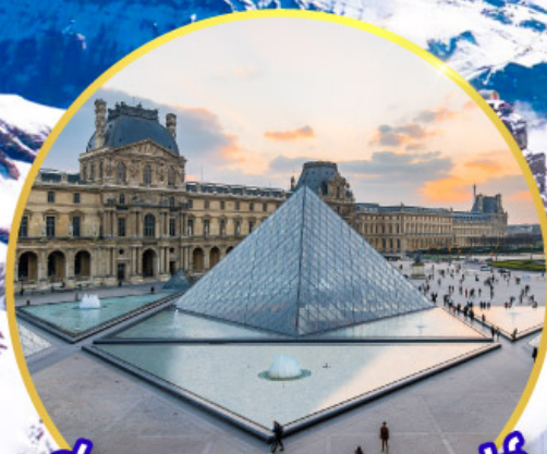
ถ่ายรูปคู่พีพีร์กันที่ลูฟร์