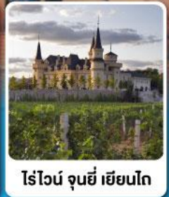
ไร่ไวน์ จุนยี่ เยียนไถ