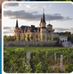
ไร่ไวน์ จุนยี่ เยียนโก