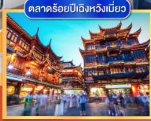
ตลาดร้อยปีเฉิงหวิงเหมียว