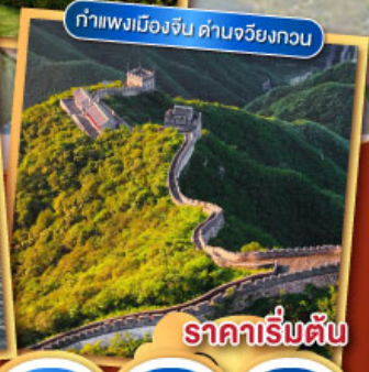
กำแพงเมืองจีน ด่านจวิ๋ยกวน