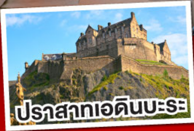
ปราสาทเอдинบะระ