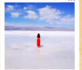
ทะเลสาบเกลือฉางซ่า