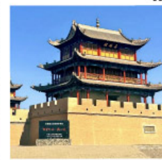
กำแพงเจียยี่กวน