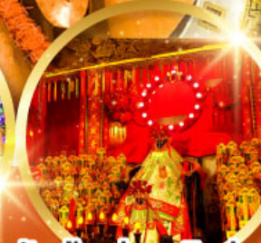
วัดเจ้าแม่กวนอิมอ้อองฮ่า (สวนหนานเท่เลียน)