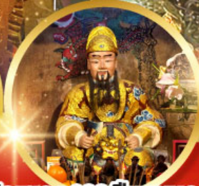
วัดแซกง 600 ปีหยุนหลอง