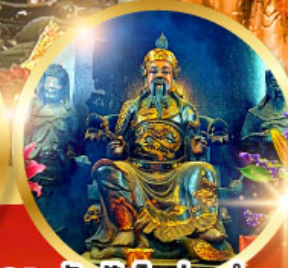
วัดปิกโต้อองฮ่า