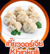
เกี้ยวจอร์เจีย Khinkali