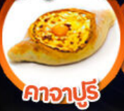
คาจ่าปู้รี่