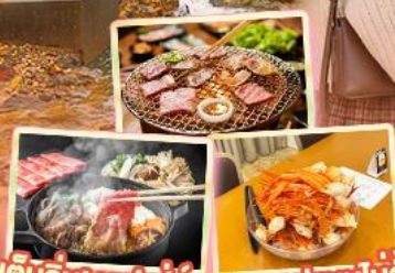
เด็มอิมิ บุฟเฟ่ต์ ซาบู+ซาปูแบบไม่อั้น ปิ้งย่าง Yakniku Buffet