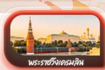
พระราชวังเครมลิน