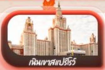
เห็นเขาสเปิร์ส