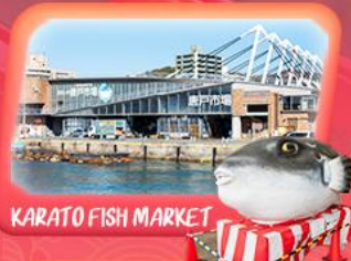
KARATO FISH MARKET

vietjetair.com สายการบิน Vietjet Air (VZ) น้ำหนักกระเป๋า 20 KG