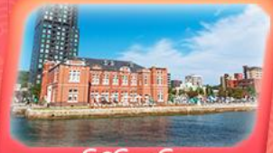
มิซึทึะ เรโทริส

สัมผัสกลิ่นอายญี่ปุ่นแท้ไปบูโห้บึง... ศาลเจ้าคาไซฟู จอพรวัดคัง วัดนินโซอิน บุนถ่ายรูปพืชม! หมู่บ้านยูฟูอินสุดน่ารัก ชมวิวทะเลสาบคินริน ย้อนอดีตกับ โมจิโกะ เรโทริส เปิดประสบการณ์นั่งเรือเฟอร์รี่ เข็อินตลาดปลาอาราโตะ ซ้อมบั้งจุกี้ อาทานิเล็กคิตะ-คิวยู และ Lalaport Fukuoka