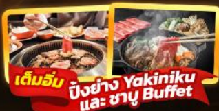
เต็มอิ่ม ปิ้งย่าง Yakiniku และ ชา-yu Buffet