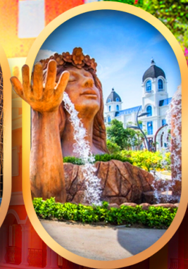
น้ำตกเทพพิหตุยง