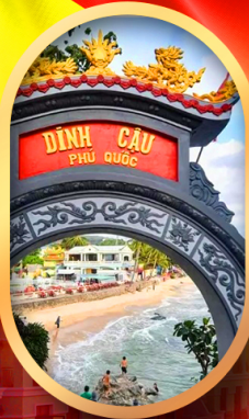
ศาลเจ้าติงเกา