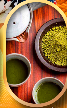
ชงชาแบบญี่ปุ่น