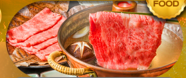
พิเศษเมนู บุฟเฟ่ต์ชาบู