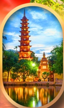
วัดเงินท็อก