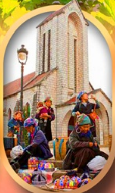
โบสถ์หินซาปา