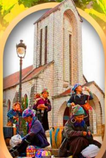
โบสถ์หินซาปา