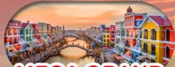
MEGA GRAND WORLD HANOI แลนด์มาร์คแห่งใหม่