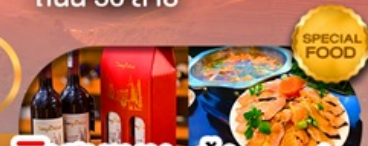
พิเศษเมนู สุกี้ปลาเซลม่อน ลิ้มรสไวน์แดงชื่อดัง เดินทาง ต.ค. 69 เป็นต้นไป