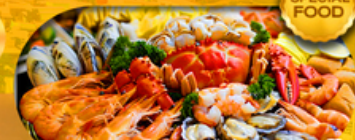
พิเศษเมนู ซีฟู้ดบุฟเฟ่ต์ 1 มื้อ เดินทาง มีนาคม 2569