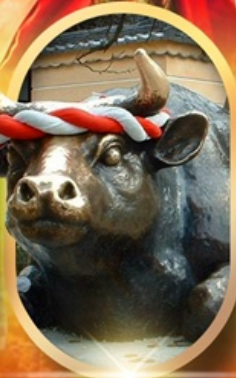
ศาลเจ้าคาซาไซฟู