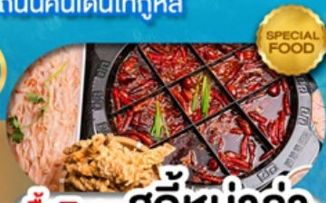
มือพิเศษ สุกี้หม่าล่า