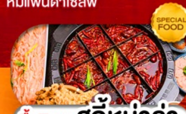
มือพิเศษ สุกี้หม่าล่า