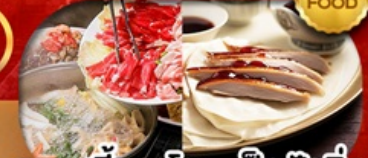
เมนู สุกี้มองโก + เปิดปักกิ่ง เดินทาง เม.ษ. - ต.ค. 69