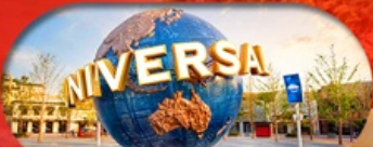
อิสระฟรีเดย์ 1 วัน หรือเลือกซื้อทัวร์เสริม US