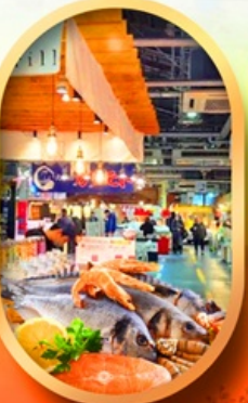
ตลาดปลาฮิองโตะ