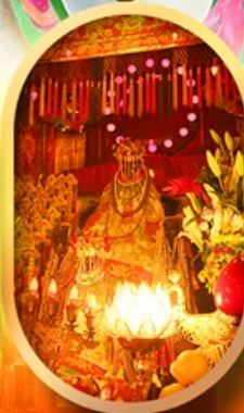
เจ้าแม่กวนอิมทองคำ