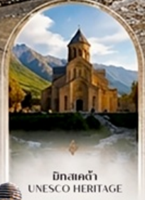
มัทสเคต้า UNESCO HERITAGE