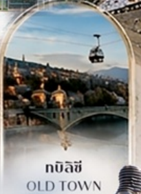
ทบิลีซี OLD TOWN