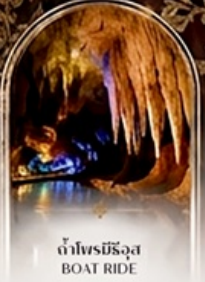
ดำโพรมิริอัส BOAT RIDE

เดินทางช่วงปีใหม่ 27 ธ.ค. - 3 ม.ค. 70 ราคาเพียง 75,989 บาท / ท่าน