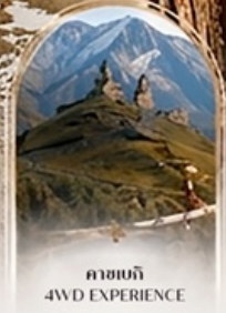
คาสเบกี 4WD EXPERIENCE