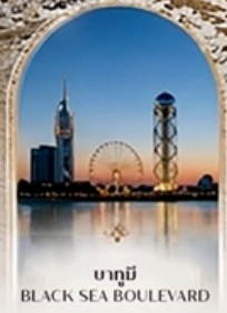
บาทุมี BLACK SEA BOULEVARD