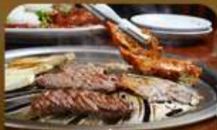
เมนูช่างสโวล์เกาหลี