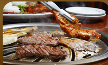
เมนูข้างสโตร์เกาหลี