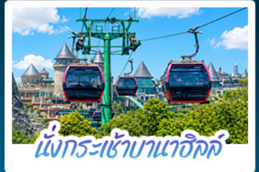
นั่งกระเช้ามาเออิลค์