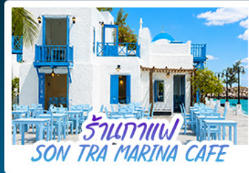
ร้านอาหาร SON TRA MARINA CAFE