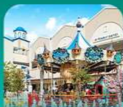
ลือชเต็ เอ้าท์เก็ต