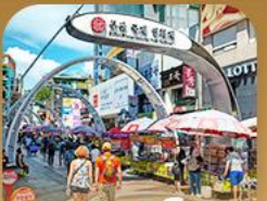
ตลาดนัมโพดง