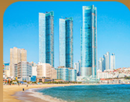
หาดแฮอินแด