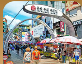
ตลาดนมโพแดง