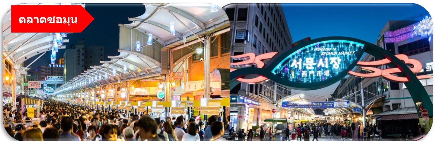
ตลาดชอมุน

นำท่านเที่ยวชม ตลาดชอมุน (Seomun Market) ตลาดพื้นเมืองชื่อดัง ที่มีประวัติยาวนานตั้งแต่สมัยโชซอน และถือเป็นหนึ่งในตลาดดั้งเดิมที่ใหญ่ที่สุดของเกาหลีใต้ ภายในเต็มไปด้วยของกินสตรีทฟู้ด ร้านผ้า เสื้อผ้า ของฝาก และบรรยากาศท้องถิ่นแบบเกาหลีแท้ ๆ ไฮไลท์ห้ามพลาดคือ "ตลาดกลางคืน" ที่คึกคักไปด้วยอาหารพื้นเมืองสุดอร่อย เช่น มัณฑูแป็งเคียงแบน และดอกบกกี