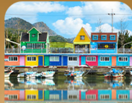
ท่าเรือจังกึม