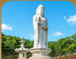
วัดดงฮวาซา

เปิดประสบการณ์เที่ยวเกาหลีสุดคุ้ม บนครั้งเดียว เที่ยวสองเมือง • เช็กอินถนนนักร้องคิมควังซอก สัมผัสเสน่ห์ศิลปะและเสียงเพลง • นั่งรถไฟบุกเบิกชมวิวทะเลปูซาน • หมู่บ้านคิมซอนสีสดใส ก่อนเยือนวัดแฮดงยงกุงซาและวัดคงฮวาซา เสรรมความเพลิดเพลิน • แวะชมท่าเรือสีรุ้ง Bunezia ปิดท้ายด้วยชายหาดแฮอินแดนซ์มาร์เก็ตชื่อดัง พร้อมเดินช้อปปิ้ง Walking Street สุดฟิว