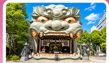
ศาลเจ้านัมมะ ยาสากะ