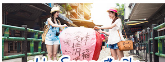
ปล่อยโดมลอยซื้อที่ฟิน