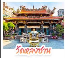
วัดเลกงซัน