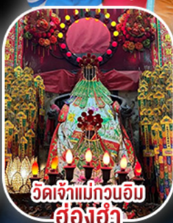
วัดเจ้าแม่กวนอิม ฮ้องอ่า