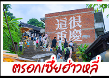
ตรอกซี้ซ่าวหลี่