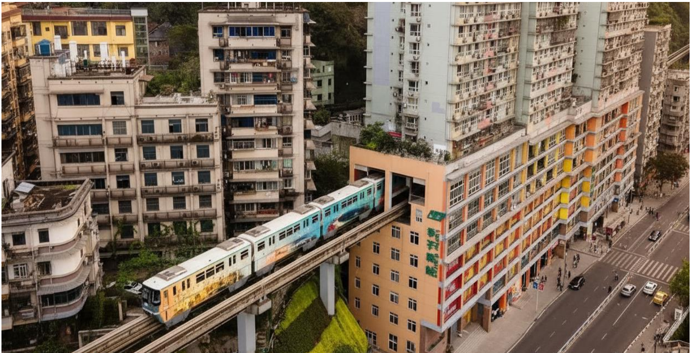
บ่าย นำท่านแวะเช็คอิน สถานีรถไฟฟ้าทะเลตุ๊ก (Liziba Station) ชมภาพรถไฟฟ้าวิ่งทะลุกลางอาคารพักอาศัยอย่างกลมกลืน ขบวนแล้วขบวนเล่าที่แล่นผ่านไปอย่างแม่นยำไร้เสียงรบกวน กลายเป็นสัญลักษณ์ระดับโลกของความอัจฉริยะทางวิศวกรรมและการออกแบบเมือง ที่สะท้อนแนวคิด “เมืองซ้อนเมือง” ของ