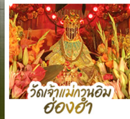
วัดเจ้าแม่ทวนอิม ฮ่องฮ่า