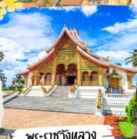
พระราชวังหลวง