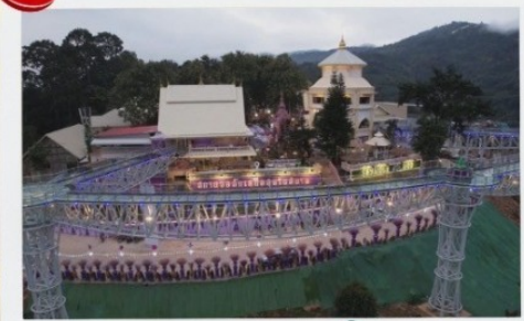
ศกยวอลค์

2 ท่านขึ้นไป 14,499 บาท/ท่าน 4 ท่านขึ้นไป 12,799 บาท/ท่าน 6 ท่านขึ้นไป