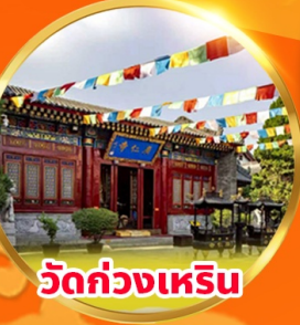
วัดกวางเหริน