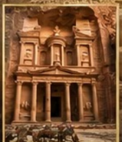
นครเพตรา