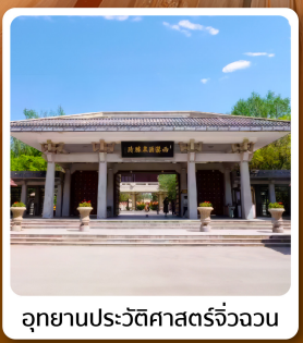
อุทยานประวัติศาสตร์จิวววน

ไฮไลท์! เขตท่องเที่ยวเกี่ยวเกี่ยวจิ้งจางหม่า ชมทุ่งหญ้าและภูเขาสวยแห่งกานซู ภูเขาสายรุ้งจางเย่ต้นเสี "มหัศจรรย์ภูเขาสายรุ้งหลากสี"