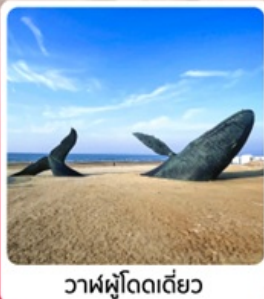
วาฬผู้โดดเดี่ยว