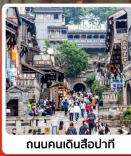
ถนนคนเดินสี่อ่าทิ่