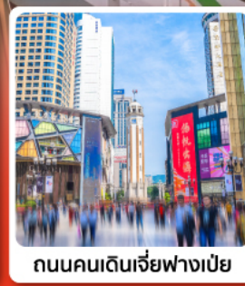
ถนนคนเดินเจียงฟางเป่ย์