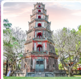
วัดเทียนมู่