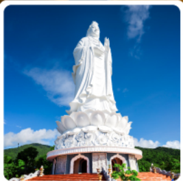
วัดลินฮ้าง

• โฮลท์ นั้งกระเซ้าขึ้นยอดเขาบานาฮิลล์ ชมเมืองโบราณฮอยอัน สักการะเจ้าแม่กวนอิม