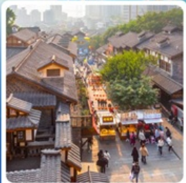
ถนนคนเดินสี่ปาตี