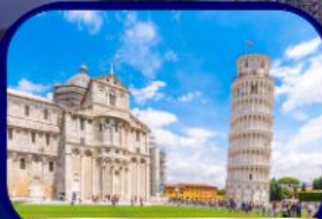
หอเอนแห่งเมืองปิซ่า