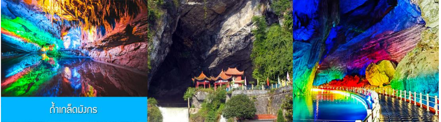
ถ้ำเกล็ดมังกร

พักที่ JINMA HOTEL ระดับ 4 ดาวท้องถิ่นหรือเทียบเท่าในเมืองเซียนเฉิน