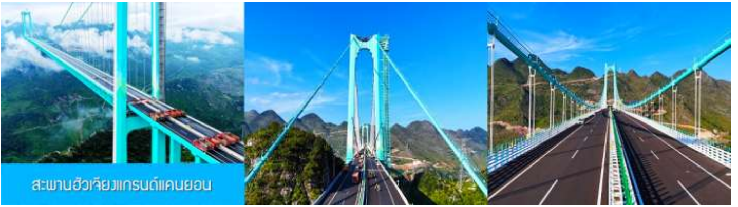
สะพานฮิวเวียงเกรนด์แคบยอน

ไกด์นำเสนอสถานที่ OPTIONAL TOUR แพคเกจเที่ยวชมตัวสะพาน รวมค่าบัตรนั่งลิฟท์แก้วขึ้นสู่ชั้นชมวิวบนทาวเวอร์ รวมค่ารถรับส่งจากศูนย์บริการนักท่องเที่ยวสู่ตัวสะพาน รวมกาแฟบนหอคอยชมวิวท่านละ 1 แก้ว อัตราค่าบริการ 380 หยวนหรือ 1,900 บาทต่อท่าน