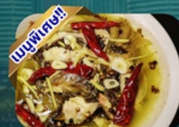
ปลาต้มผักกาดดอง