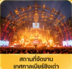
สถานที่จัดงาน เทศกาลเบียร์ชิงเต่า