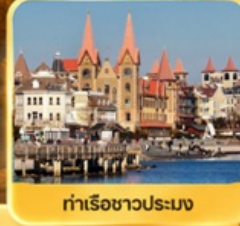
ท่าเรือชาวประมง