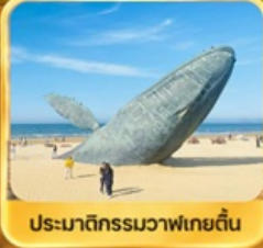
ประมาติกรรมวาฬเกยตื้น